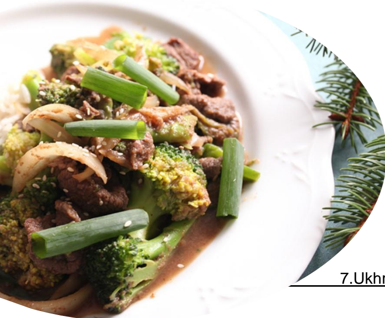
7.Ukhriin makhan khuurga